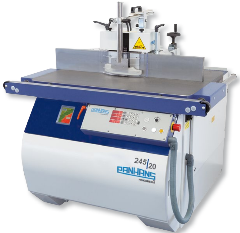
Abbildung zeigt Optionen

Positioniersteuerung für Höhen- und Schwenkverstellung mit elektr. Positions- und Drehzahlanzeige, sowie Nullung der Höhe und Versatzmaßfahrt.